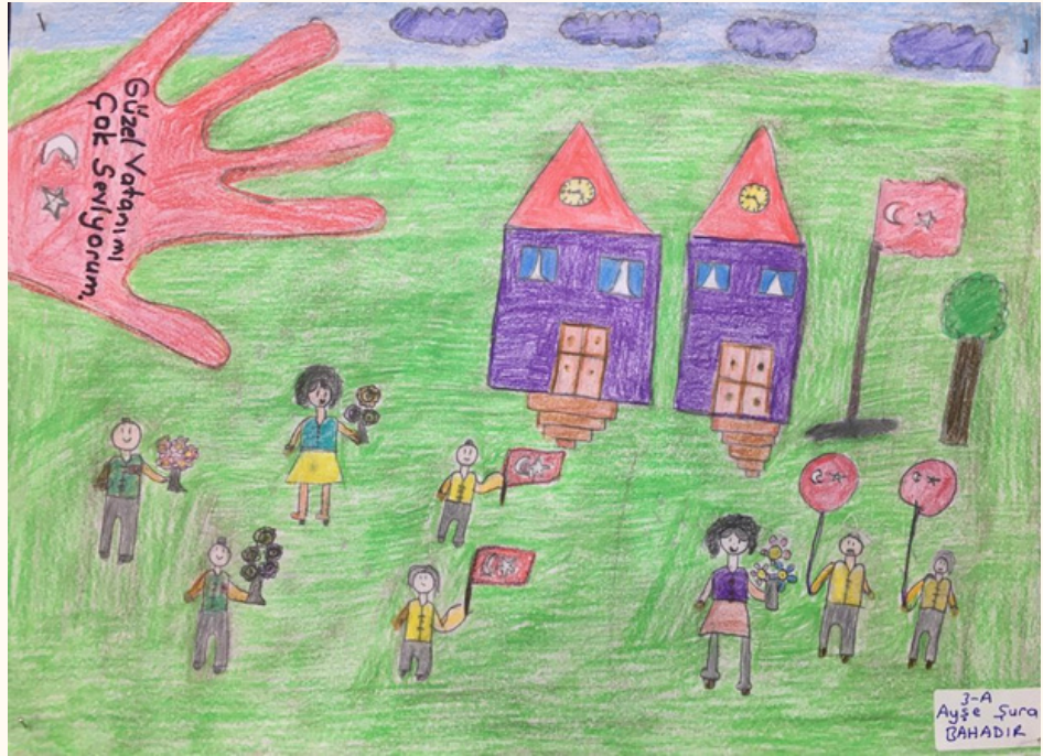
Ayşe Şura BAHADIR 3-A