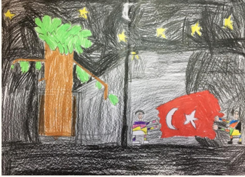
Hikmet Miraç TAŞKAN 3-C