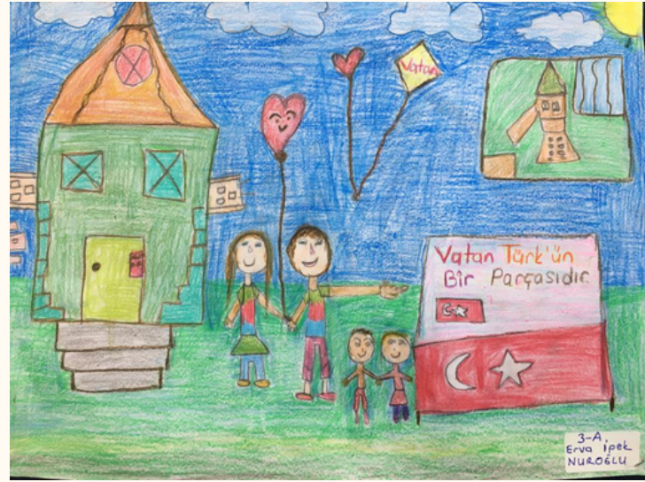
Erva İpek NUROĞLU 3-A