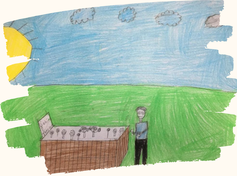
Abdülşamet ÖKTEM 3-C