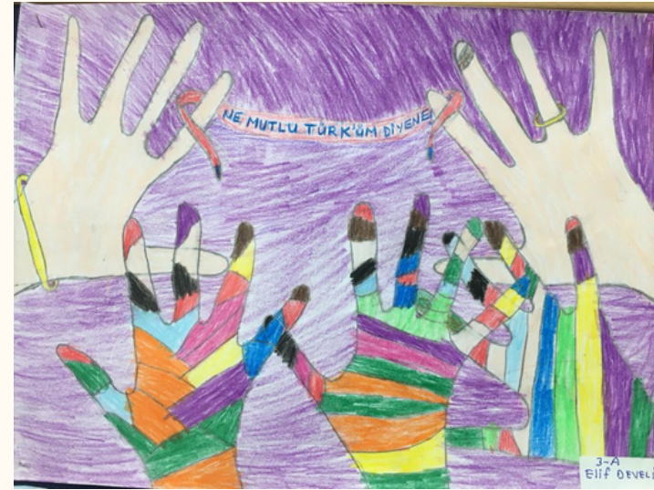
Elif DEVELİ 3-A