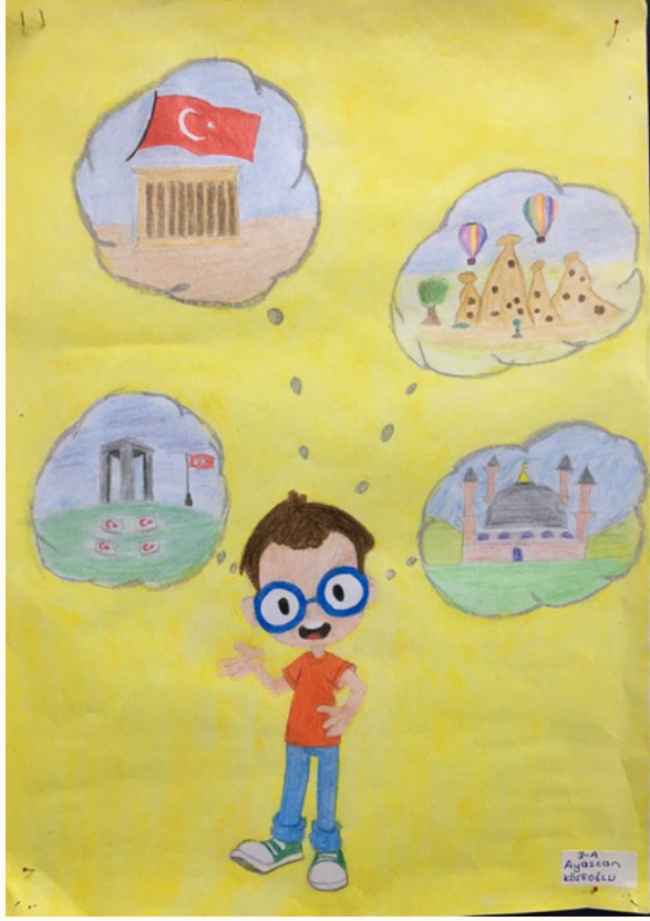
Ayazcan KÖSEOĞLU 3-A